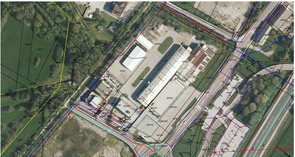
Slika 3: Gospodarska javna infrastruktura (rumena linija – plinovodno omrežje; temno rdeča linija – kanalizacijsko omrežje sanitarnih odpadnih voda; rdeča linija – elektroenergetsko omrežje; temno modra linija – vodovodno omrežje; svetlo modra linija – omrežje padavinskih odpadnih voda; temno vijola linija – javna razsvetljava; oranžna linija – TK omrežje; iObčina, januar 2022).

Na območju SD OPPN je urejeno javno vodovodno omrežje, kanalizacijsko omrežje sanitarnih in padavinskih odpadnih voda, elektroenergetsko in TK omrežje, plinovodno omrežje in javna razsvetljava.