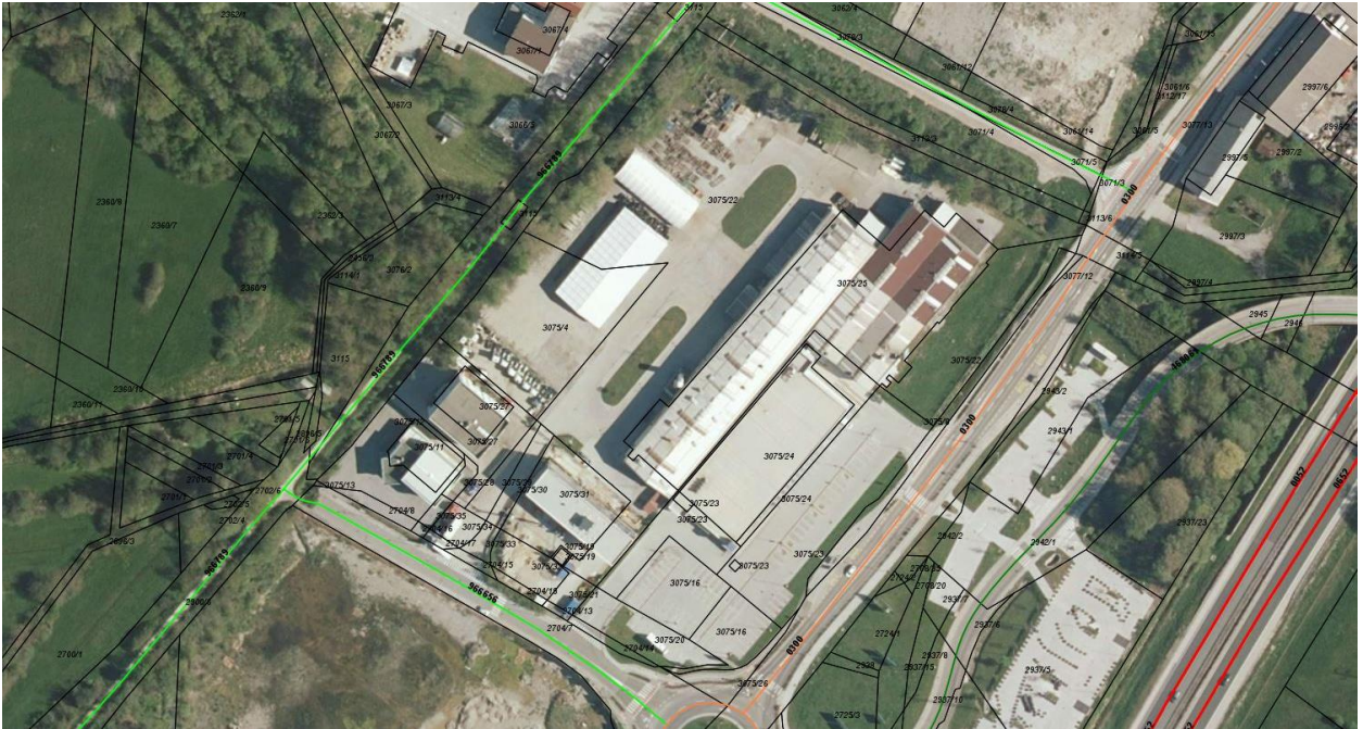
Slika 2: Javne ceste na območju SD OPPN in širše (javna pot 966656 – Cesta G; regionalna cesta 0300 – Brezovica – Vrhnika; iObčina, januar 2022).

Na območju SD OPPN je urejeno javno vodovodno omrežje, kanalizacijsko omrežje sanitarnih in padavinskih odpadnih voda, elektroenergetsko in TK omrežje, plinovodno omrežje in javna razsvetljava.