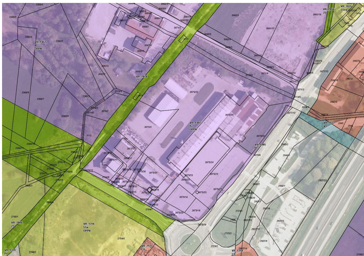
Slika 1: Izsek podrobne namenske rabe prostora iz OPN Občine Vrhnika (iObčina, januar 2022).

Območje urejanja je pozidano in infrastrukturno urejeno. Zemljišča na območju urejanja so v lasti Lidl d. o. o., k. d.