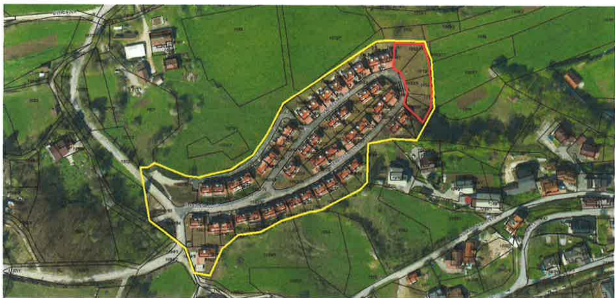
Slika: Prikaz območja OLN in spremembe OLN

Spremembe in dopolnitve se nanašajo na OLN Gabrče 3, ki ureja stanovanjsko naselje na Gabrčah. Območje OLN je že večinoma pozidano. Nepozidana so samo še zemljišča s parc. št. 1053/8, 1053/9, 1053/10, 1053/11, vse k.o. Vrhnika, ki sodijo v morfološko enoto 11, na kateri je predvidena gradnja štirih stanovanjskih objektov (V1-4).