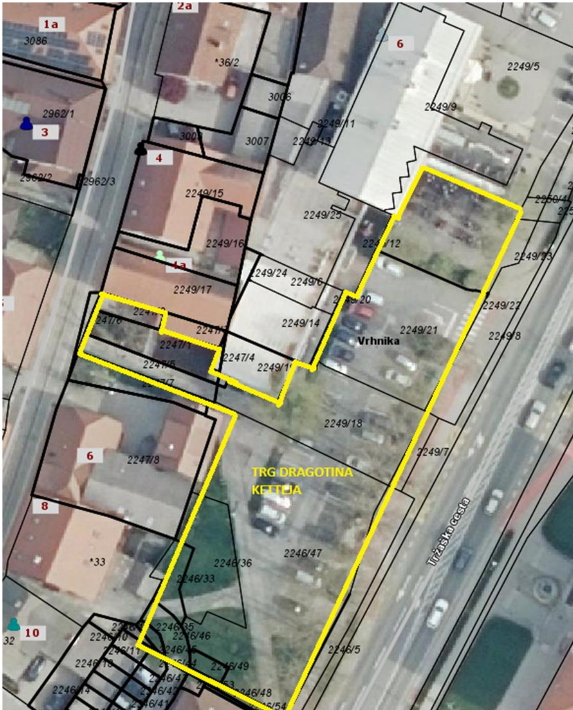
Priloga 1: Grafični prikaz ulice »Trg Dragotina Ketteja« v naselju Vrhnika